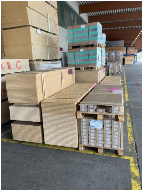
Lagerung Sprint Spedition

Laminat und OSB-Platten wurden an betroffene Bewohner in der Innenstadt und Zweifall verteilt. Die anderen Hilfsgüter hat das Sozialkaufhaus Stolberg für die Flutopfer erhalten.