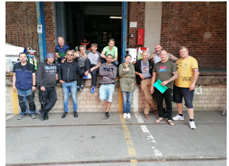
Alle Beteiligten (Teamarbeit)