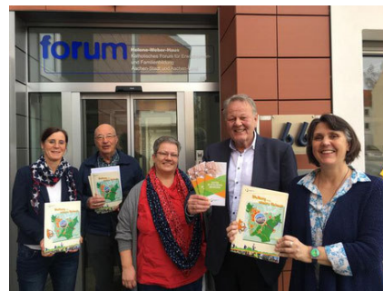
aus Presseartikel Stolberger Zeitung/Stolberger Nachrichten vom 16.01.2020